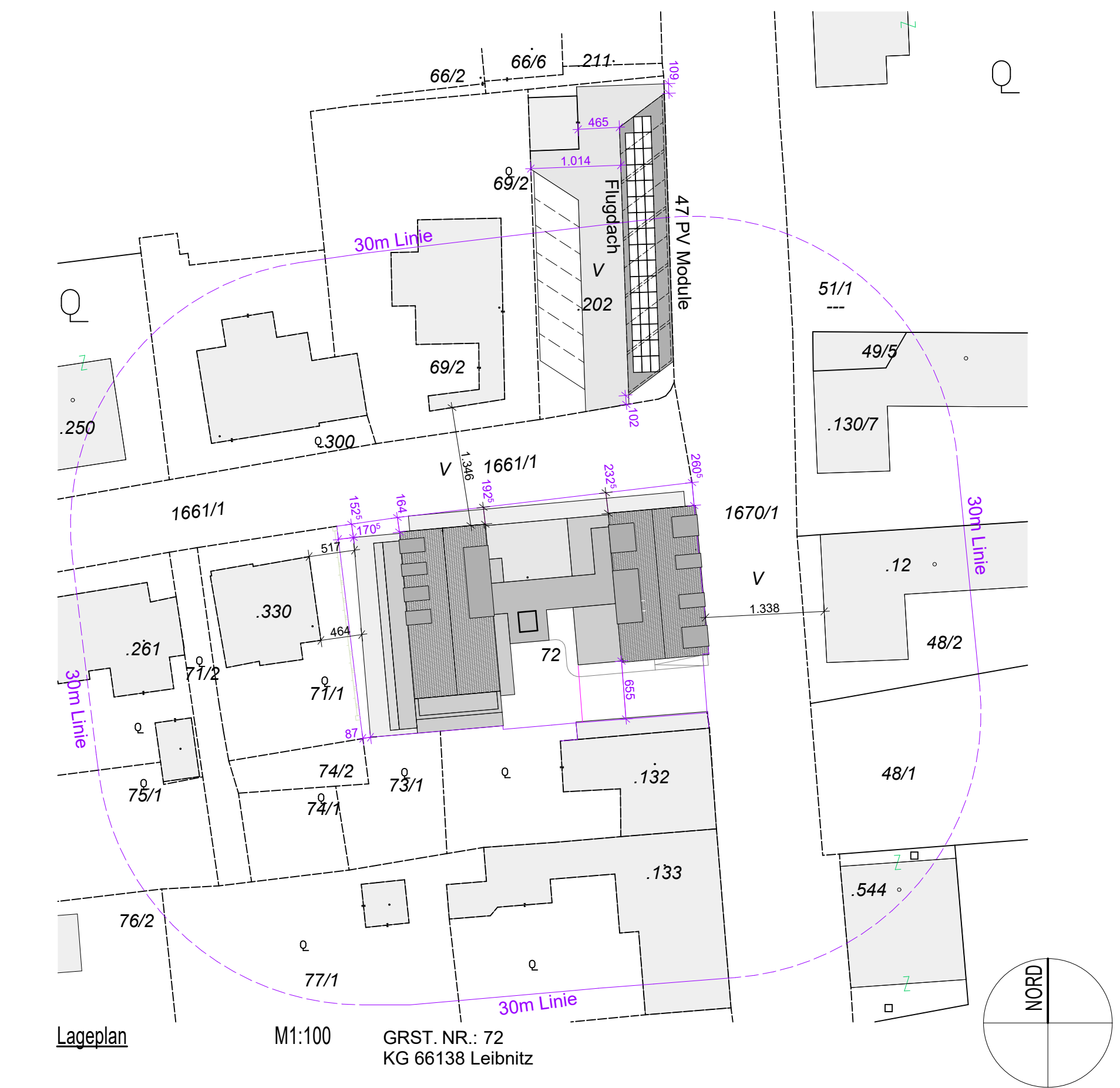
Lageplan M1:100 GRST. NR.: 72 KG 66138 Leibnitz