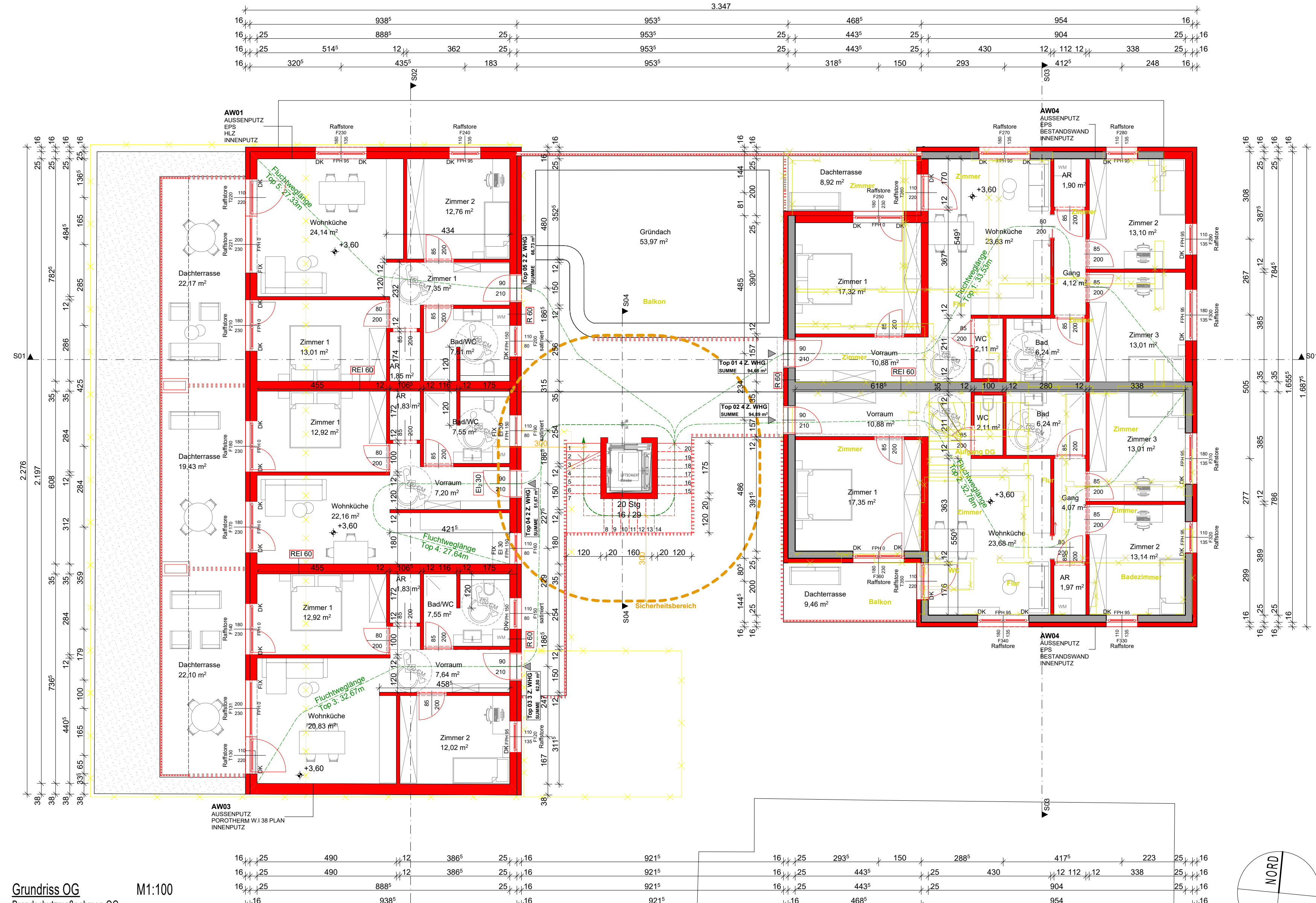
Grundriss OG M1:100 Brandschutzmaßnahmen OG tragende Bauteile : R 60 Trennwände REI 60 bzw. EI 60 Decken und Dachschrägen mit einer Neigung \leq 60^\circ : REI 60 Außentreppe, vorgehängte Profile und Gangstützen : A2 Fassade: D